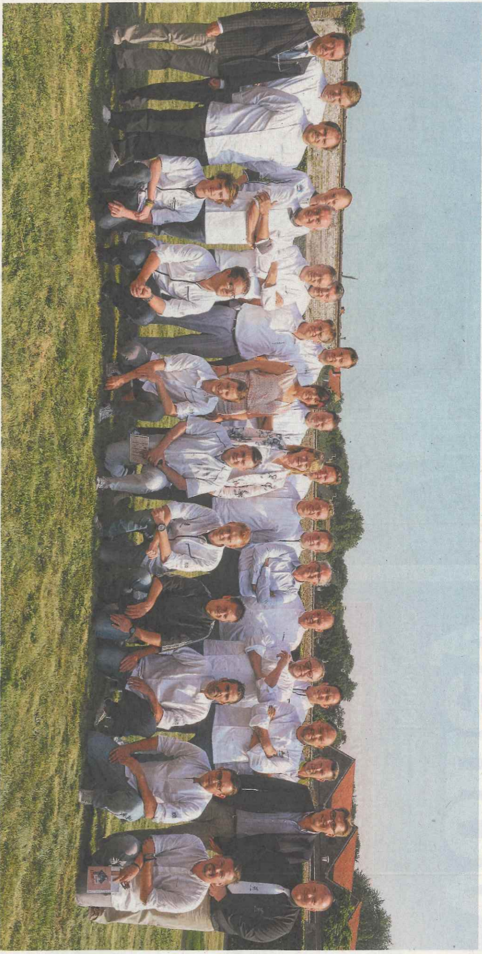
Eenendertig Brugse topchefs, goed voor acht Michelinsterren, zullen van zaterdag 24 tot en met maandag 26 september kokkerellen op de balkonronde aan de achterkant van het station.