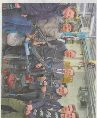
Leerlingen van de Sint-Martinusschool in Asse bezochten het atelier van Eddy Merckx Cycles in Zeilk.